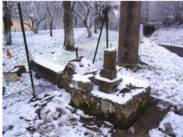
Le calvaire de Coinchimont , embouti par un véhicule le 20 janvier 2015, a fait l'objet d'une réfection par un tailleur de pierre de Sauley-sur-Meurthe ( entreprise B. GÉRARD )