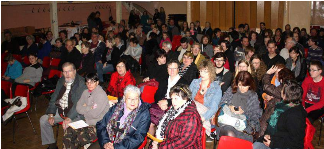
Le public, toujours très nombreux et enthousiaste

Les Baladins ont accueilli plus de 1 000 spectateurs sur les 7 représentations de 2015 !