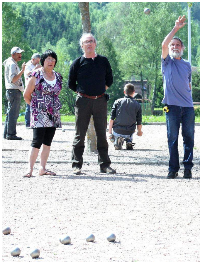
Proposé par la section « détente et loisirs » de l'ASCB