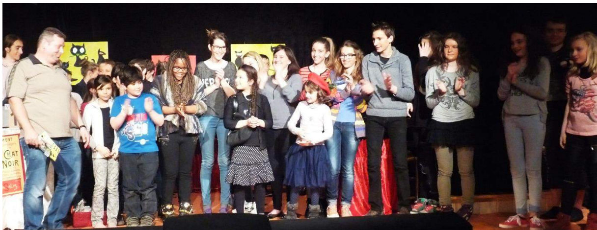
La Section des Jeunes (33 membres) a joué 3 pièces – Représentation du 15 mars

Les Baladins ont accueilli plus de 1 000 spectateurs sur les 7 représentations de 2015 !