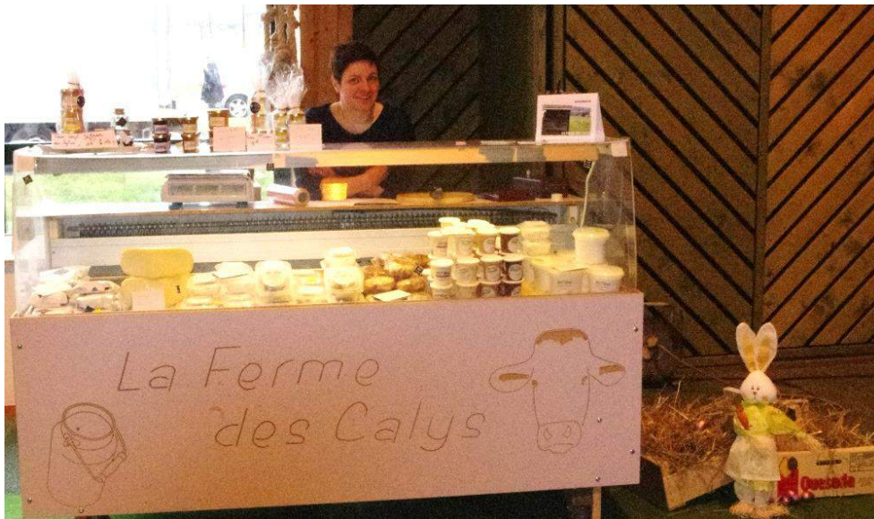
Stand de fromages fermiers et de safran (Ferme des Calys à Wisembach)

Les stands de ce marché organisé au Centre sportif par l'Amicale des Sapeurs-pompiers offraient un large choix et ont eu beaucoup de succès