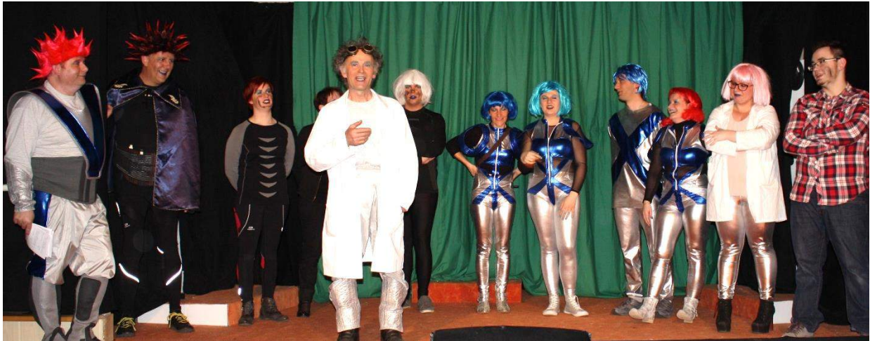
Section des Adultes – Représentation du 14 mars (pièce « Projet X23 » de Stéphane TITECA)