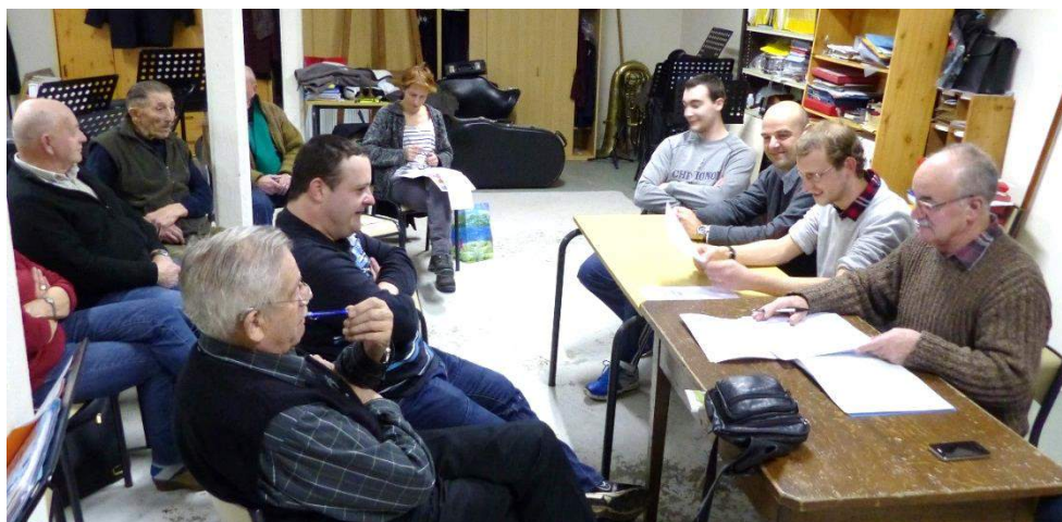
Assemblée générale du 13 février 2015 – salle de musique de Verpellière